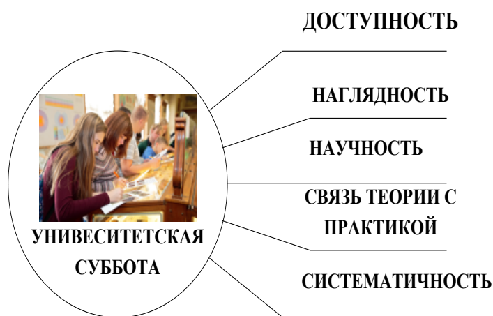
Рис.2. Основные дидактические принципы, применяемые в естественнонаучном музее университета в рамках проекта «Университетская суббота»

Для образовательного занятия в формате «Университетская суббота» в музее университета, несомненно, не менее чем планирование, важно соблюдение дидактических принципов педагогики, т.е. основных положений, определяющих содержание, а также формы и методы в соответствии с выбранными целями. Как правило, выделяют следующую систему дидактических принципов: сознательности и активности, наглядности, систематичности и последовательности, прочности, научности, доступности, связи теории с практикой. В университетском музее в рамках рассматриваемого проекта, с нашей точки зрения, на первом месте стоят доступность, наглядность, научность и связь теории с практикой (Рис.2).