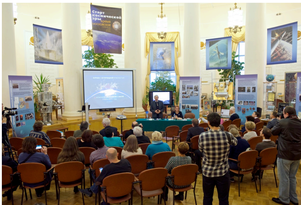
Рис. 1. Презентация выставки «60 лет в Космосе» 9 октября 2017 г.

Выставка организована совместно Государственным музеем истории космонавтики (г. Калуга), Музеем земледования, ГАИШ и Музеем истории МГУ им. М.В. Ломоносова при участии Группы туристических компаний «Кандагар» (г. Севастополь).