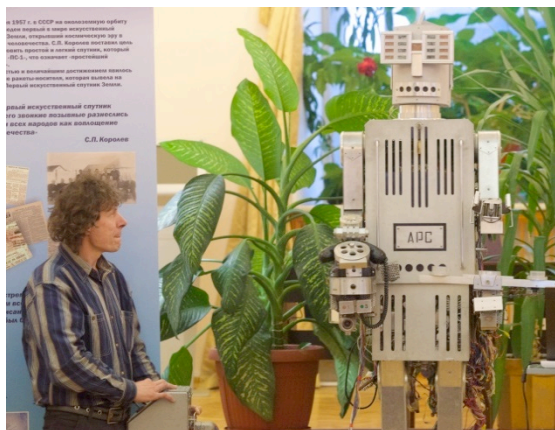
Рис. 2. Демонстрация робота APC (Автоматического Радиоэлектронного Секретаря), отметившего накануне выставки своё 50-летие.

Украшением выставки является серия космических баннеров, подготовленная художником О.В. Головановой. Они посвящены предвестнику космонавтики Константину Эдуардовичу Циолковскому, давшему свой прогноз на развитие человечества к 2017 году, Александру Леонидовичу Чижевскому – глубочайшему исследователю взаимосвязи земных процессов с космическими силами, создателю космических кораблей Сергею Павловичу Королёву.